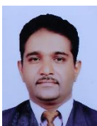
ජී.ජී.ආර්.සිල්වා මැතිතුමා ගරු සභාපති